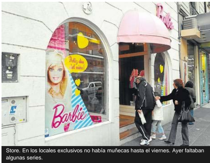
Store. En los locales exclusivos no había muñecas hasta el viernes. Ayer faltaban algunas series.

Recién el jueves las muñecas Barbie fueron autorizadas a entrar al país después de meses de esperar su turno en la Aduana. Su dueña, Mattel, tuvo que hacer lo imposible para distribuirlas en sólo dos días y los consumidores, malabares para conseguir el modelo preferido por cada niña ya que un relevamiento de PERFIL mostró que hubo faltantes en gran parte del país.